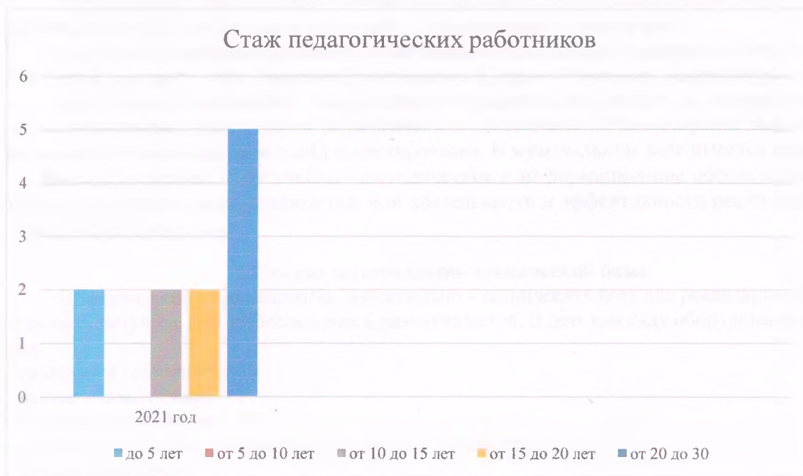
Диаграмма с характеристиками кадрового состава детского сада

В 2021 году педагоги Детского сада приняли участие: на краевом семинаре «Вариативность дошкольного образования – требование времени»; в «Российско-Белорусском форуме памяти и славы»; в городском конкурсе «Непоседы».